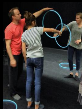
Découverte de la Manipulation graphique avec Pich et Joseph – Festival Circonova 2018